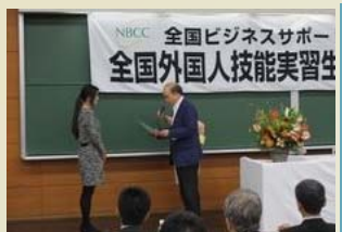
TTS Linliu Nhận bằng khen vì thành tích đỗ kỳ thi Năng lực tiếng Nhật từ Chủ tịch Nakajima.