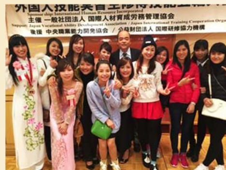
Rất đông TTS đã đến để cổ vũ, tiếp thêm động lực cho 2 bạn.

※ Kỳ thi hùng biện kỹ năng do Hiệp hội quản lý và đào tạo nhân lực quốc tế tổ chức. Tại kỳ thi, các TTS sẽ phát biểu về quá trình, nỗ lực, cảm tưởng của mình bằng tiếng Nhật khi thực tập kỹ năng tại Nhật Bản.